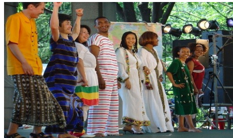
Japan Association for Global Education

URL Email はこのQRコードを スマホで読み込んでください。読み込むと スマホですぐにWebを見ることができます。