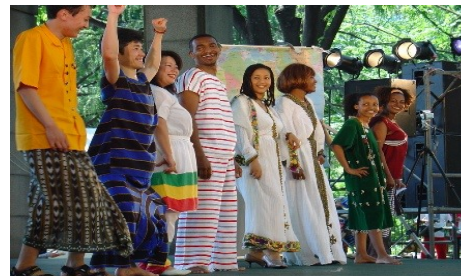
Japan Association for Global Education

URL Email はこのQRコードを スマホで読み込んでください。読み込むと スマホですぐにWebを見ることができます。